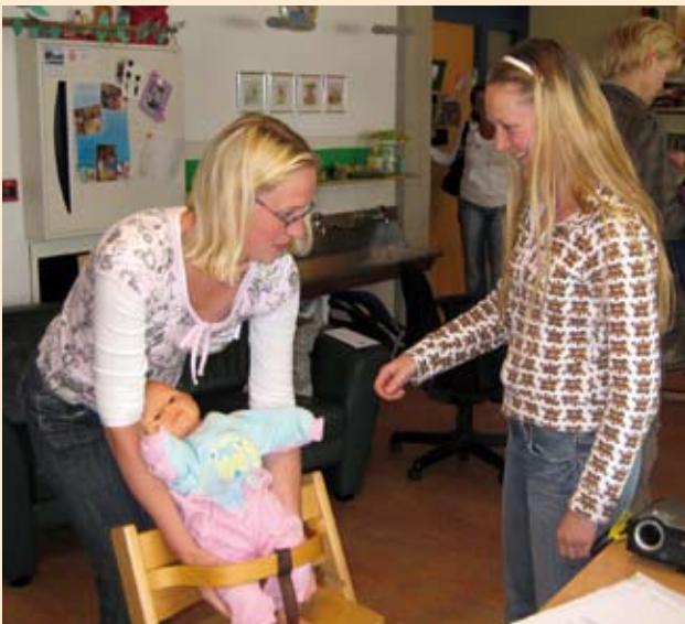
Ergocoaches tijdens opfriscursus bij ASKA

De Ergocoaches en de organisatie zijn zó enthousiast geraakt, dat besloten is in 2009 weer een opfriscursus te verzorgen. In deze cursus zullen de deelnemers hun praktische vaardigheden en coachingstaken opfrissen en verdiepen. Hierdoor kunnen zij op een gedegen en inspirerende wijze hun collega's stimuleren om gezond te werken. Dit gebeurt onder andere door op een leuke en aansprekende manier een onderwerp te leren presenteren tijdens een werkoverleg. Als achtergrondinformatie wordt gebruik gemaakt van door het FCB (Fonds Collectieve Belangen) uitgegeven publicaties. Dit zijn: de 'Ergonomiewijzer voor het verminderen van fysieke belasting in de kinderopvang en peuterspeelzalen' en de 'Tilwijzer met ergonomische adviezen voor werkhoudingen en handelingen in de kinderopvang en in peuterspeelzalen'.