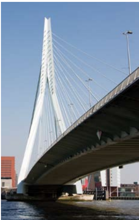
De Erasmusbrug in Rotterdam