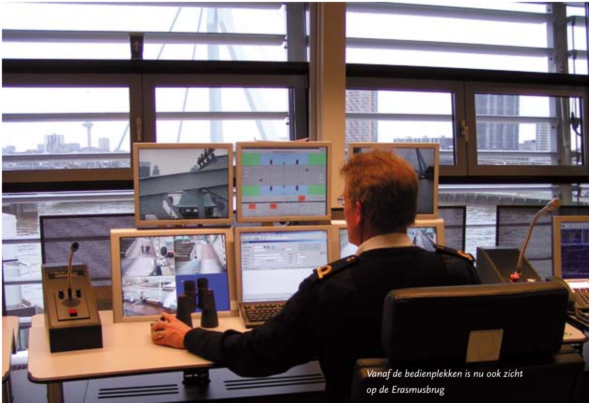
Vanaf de bedienplekken is nu ook zicht op de Erasmusbrug

gen. Inmiddels wordt er naar tevredenheid vanaf de vernieuwde post bediend en daarmee is tevens het 'Masterplan Bruggen en sluizen' voor het Havenbedrijf Rotterdam afgerond.