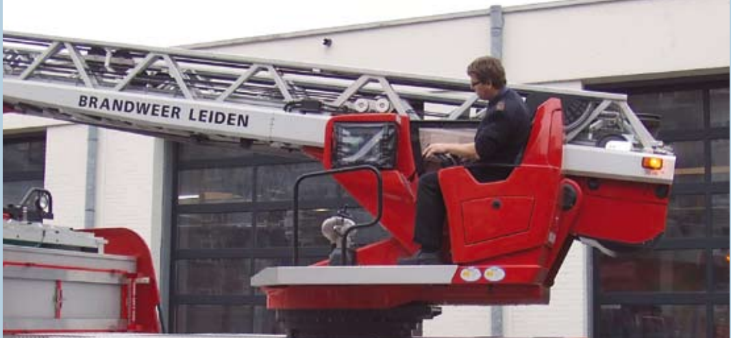
Ladderwagen Regionale Brandweer Hollands Midden