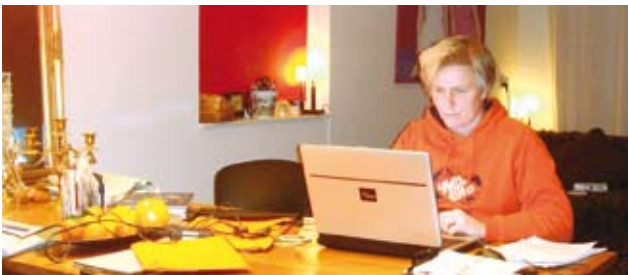
Flexibele werktijden wordt ervaren als één van de voordelen van telewerken

Meer weten: fiatammeling@ vhp-ergonomie.nl