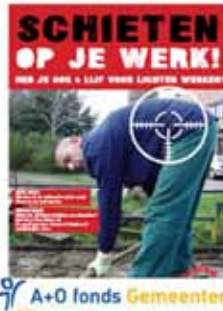
Campagne 'schieten op je werk'