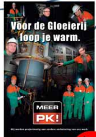
Interne communicatie Gloeierij