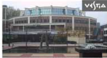
Ergonomie buitendienst Vestia